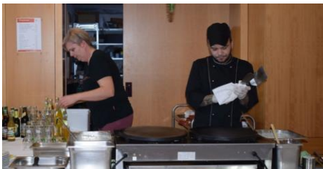
Crêpes Stand am Basar

Kulinarisch wurden unserer Gäste natürlich auch verwöhnt: Unser Küchenteam zauberte ihre Maultaschen und ihren Kartoffelsalat, selbstverständlich alles hausgemacht. Gern wurden diese auch zum Mitnehmen eingekauft.