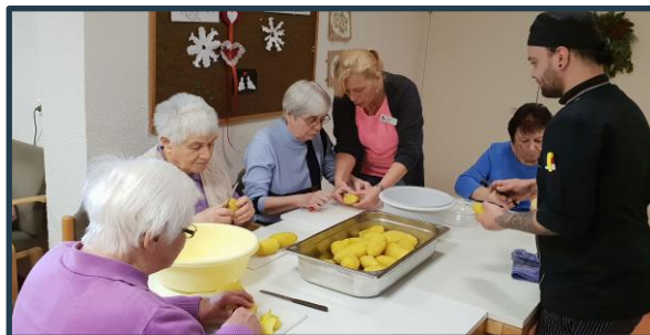
Fleißig werden Kartoffeln geschnitten..