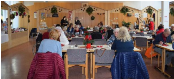
Schumm Forum im adventlichen Ambiente

Am 24.11.2018 fand wieder unser all-jährlicher Basar statt. Viele Kunsthandwerker stellten ihre Kostbarkeiten aus und freuten sich über die vielen positiven Rückmeldungen Ihrer Arbeit. Die Besucher konnten durch das Schumm Forum und in Richtung Schumm Café zahlreiche Stände besuchen und sich für die Adventszeit eindecken.