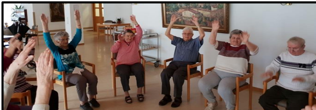
Sport tut gut und hält fit – den Körper und den Geist